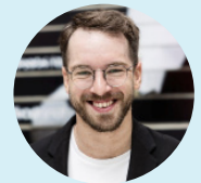
Andreas Onea Österreichs erfolgreichster Para-Schwimmer